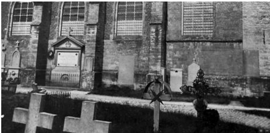
Zuidgevel met de sacristij vóór 1904.