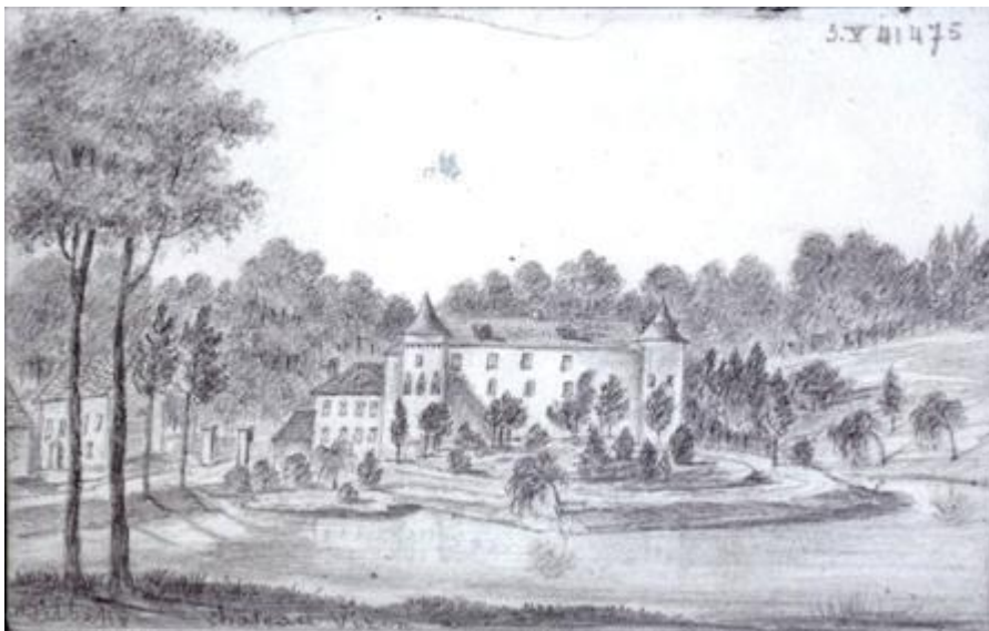
Tekening van het kasteel van Dilbeke volgens M. Maeystraeten begin 18 e .

Debet het groot Casteel van Dilbeke competerende mevrouw van den Broek jaerlijckx aen dese capelrije ses veertels rogge, die volgens capittels spijker mits korting van de hellicht der xx ste beloopen ter somme van drij guldens veethien strs twee oorden vijf m t voor het jaer verschenen kersmis 1788 ... f: 3,14,2,5 mt