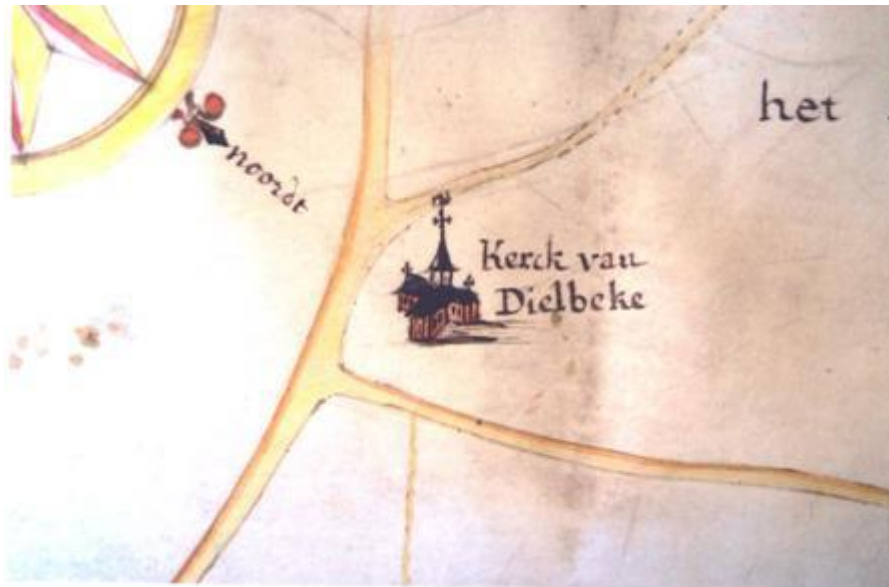
De Sint-Ambrosiuskerk in 1764. Archief OCMW Brussel.