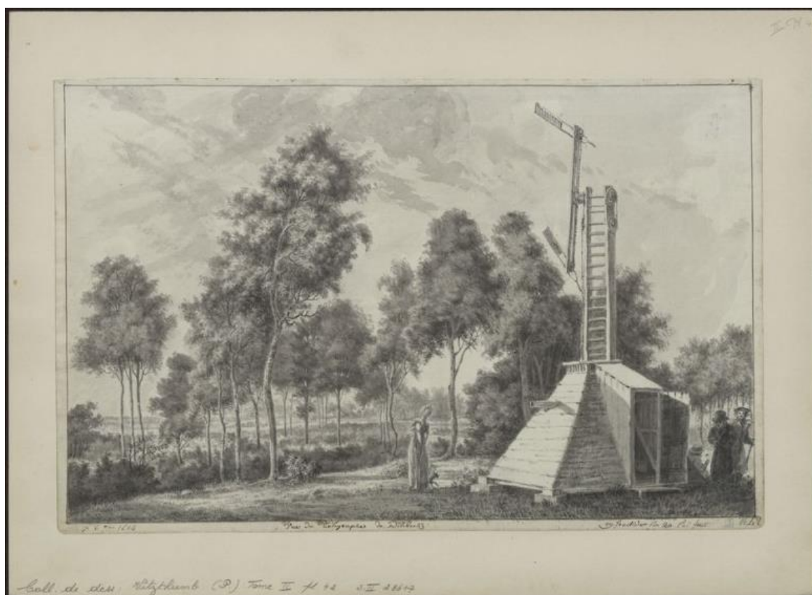
Paul Vitzthumb, Vue du Télégraphe à Dilebeeke 19 fructidor An XII 1804 Tome II plaat 42. Foto KBR

Het antwoord werd verstuurd op 21 april en luidde als volgt: “In antwoord op uw brief van de 15 e van deze maand, heb ik de eer u te laten weten dat de telegraaf die zich op het grondgebied van deze gemeente bevond, geplaatst was op een stuk land toebehorend aan de heer baron de Viron, naast de oude Ninoofse Steenweg, in het oord dat nog steeds gekend staat naar de telegraaf. Deze werd gebouwd op bevel van de Franse overheid, onder het consulaat van Napoleon I.”