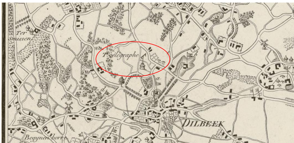
Kaart de Wautier uit 1810