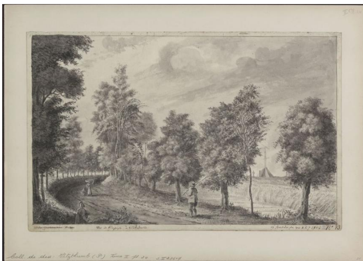
Paul Vitzthumb, Vue du Télégraphe de Dilebeeke 19 fructidor An XII 1804 Tome II plaat 23.