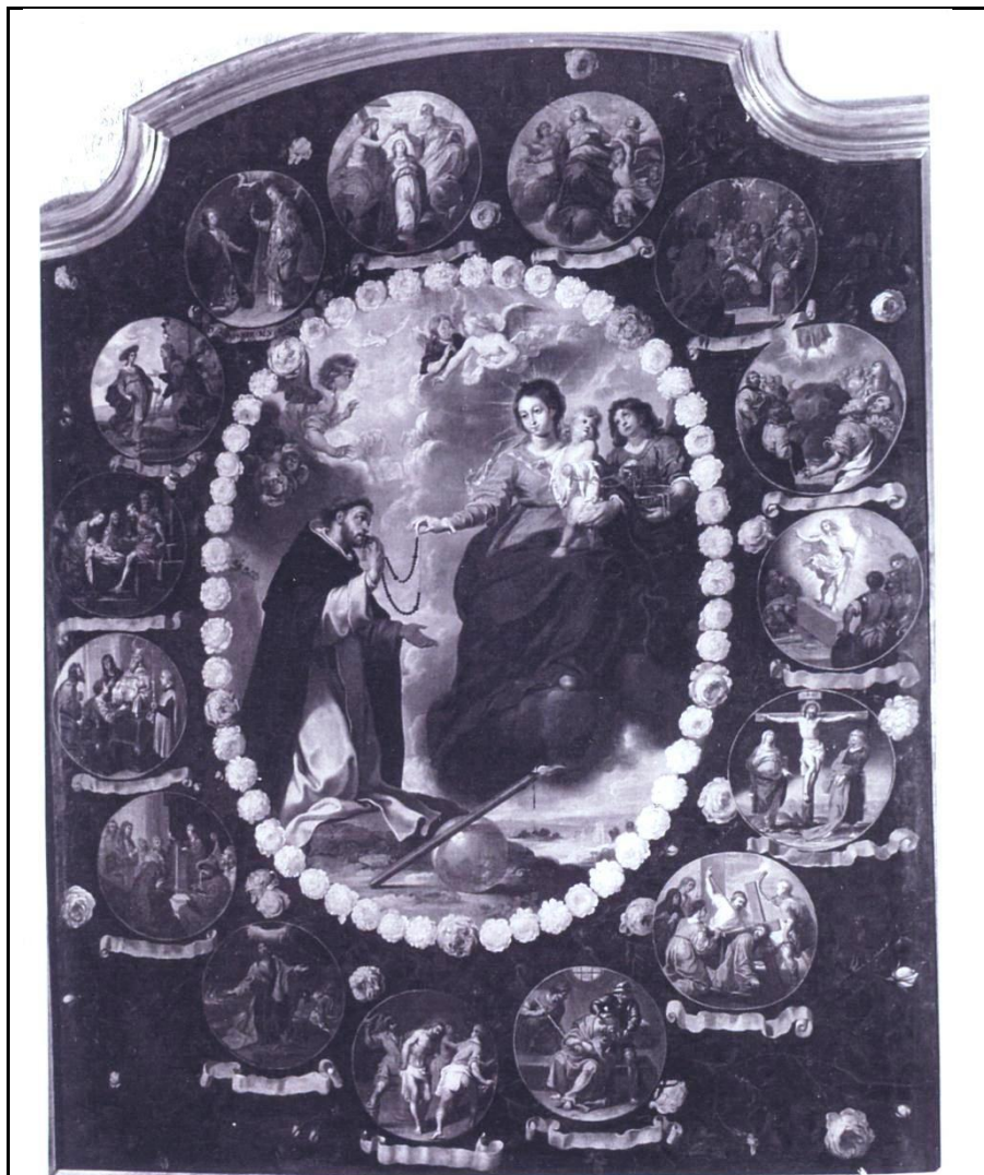
O.L.Vrouw omringd met de vijftien Geheimen v.d. Rozenkrans schenkt de rozenkrans aan Dominicus Guzman.