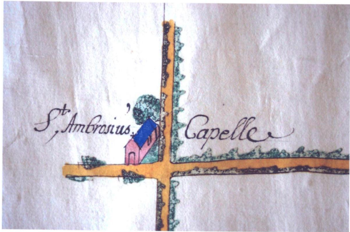
De Sint-Ambrosiuskapel in 1713. Kaartboek van het Sint-Janshospitaal.